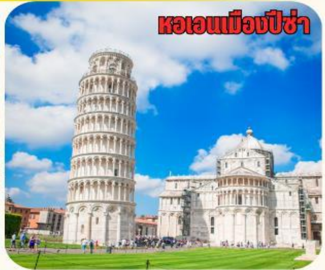
หอเอนเมืองปิซ่า