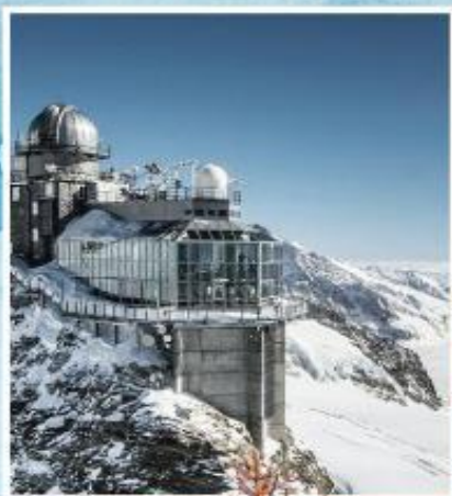
JUNGFRAUJOCH "Top of Europe"