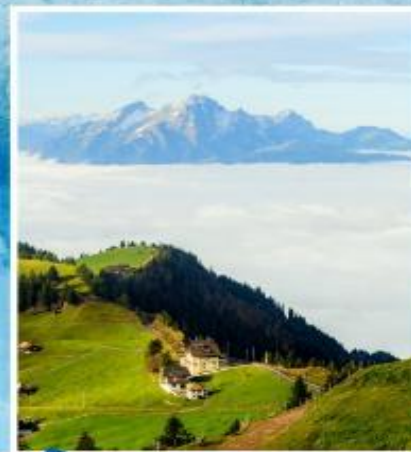
RIGI KULM Queen of the Mountains