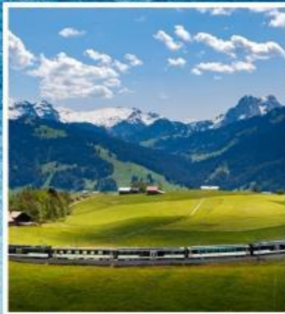
GOLDEN PASS LINE Montreux-Zweisimmen