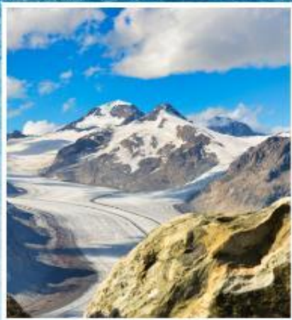
ALETCH GLACIER Riederalp, Bettmeralp