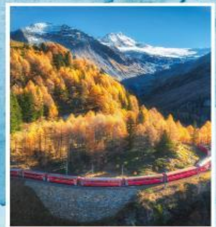
BERNINA EXPRESS Unesco

ออกเดินทาง 22-30 ต.ค. / 31 ต.ค.-08 พ.ย. 69