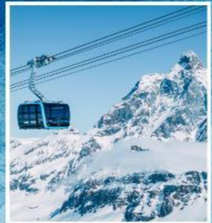
GLACIER PARADISE TOP OF ZERMATT