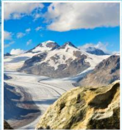
ALETCH GLACIER Riederalp, Bettmeralp

แกรนด์สวิตเซอร์แลนด์ 9 วัน QR พักหมู่บ้านเชอร์แมท(พ.ย./มี.ค.)