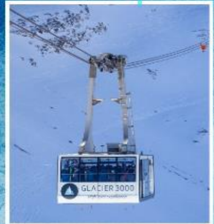
GLACIER3000 Peak walk by Tissot