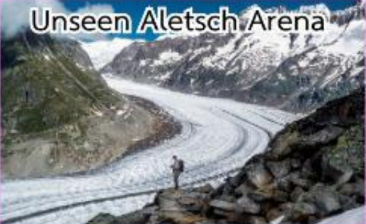
Unseen Aletsch Arena