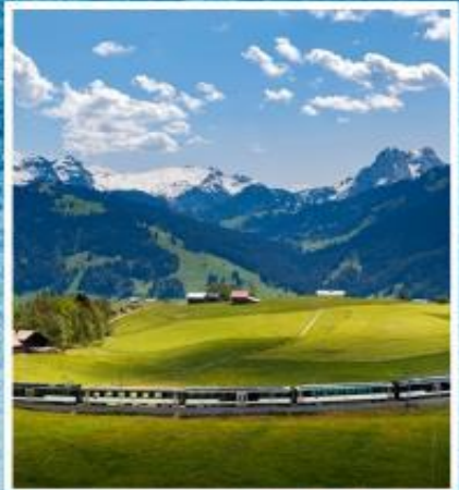
GOLDEN PASS LINE Montreux-Zweisimmen