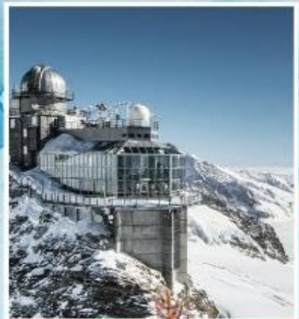
JUNGFRAUJOCH "Top of Europe"