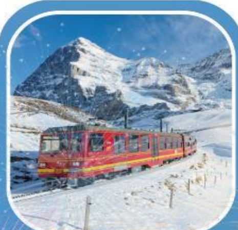
สวิสฯ 2 คืน