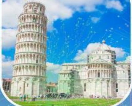
อิตาลี 2 คืน