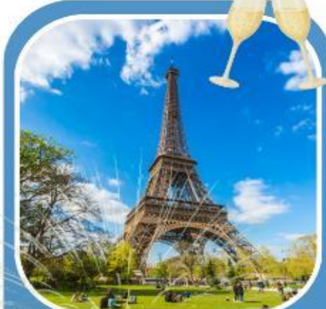
ฝรั่งเศส 2 คืน