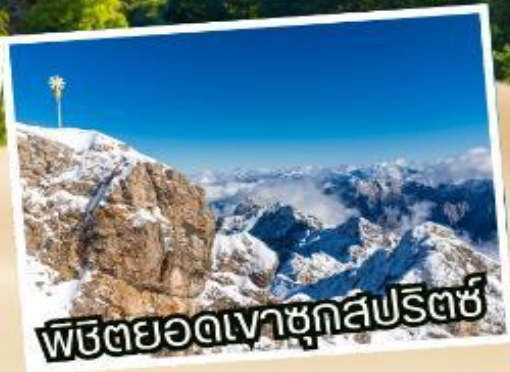
พิชิตยอดเขาชุกสปีตซ์