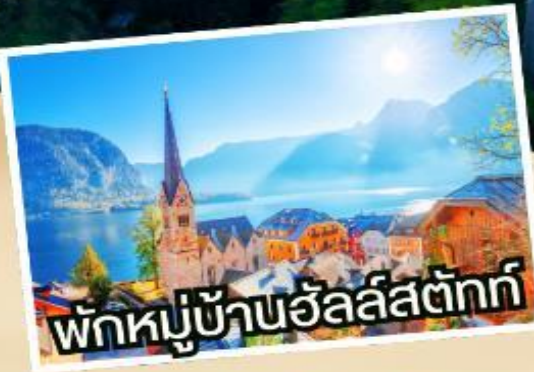
พักผ่อนที่หมู่บ้านอัลส์ตัดท์