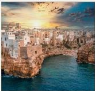
POLIGNANO A MARE

อิตาลีตอนใต้มีเสน่ห์ดึงดูดใจอย่างยิ่ง เป็นดินแดนโรมันติกแห่งปราสาท โบสถ์ และซากปรักหักพังแบบคลาสสิก ไม่ว่าจะเป็นวิลล่าโพลิญาโน อามาเร่ ร้านอาหารสุดหรูในถ้ำ GROTTA PALAZZESE พระราชวังในโพซิตาโน อ่าวเนเปิลส์มีเสน่ห์ดึงดูดใจอย่างเหลือเชื่อ ตั้งแต่เกาะคาปรีที่สวยงามตระการตาไปจนถึงภูเขาไฟที่สงบนิ่ง และแหล่งโบราณคดีระดับโลกไปจนถึงชายฝั่งอามาลฟีที่คดเคี้ยว แคว้น "ปูลยา" เป็นที่รู้จักกันดี ด้วยสถาปัตยกรรมแบบโรมานเนสก์และบาโรก ปราสาทของนักรบครูเสด และบ้านทรงกรวยคล้ายรังผึ้งที่เรียกว่าทรูลลี เป็นจุดหมายปลายทางที่กำลังมาแรง