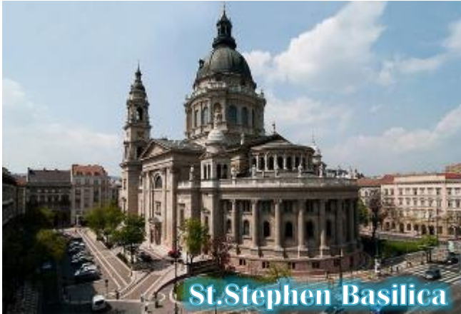
St. Stephen Basilica