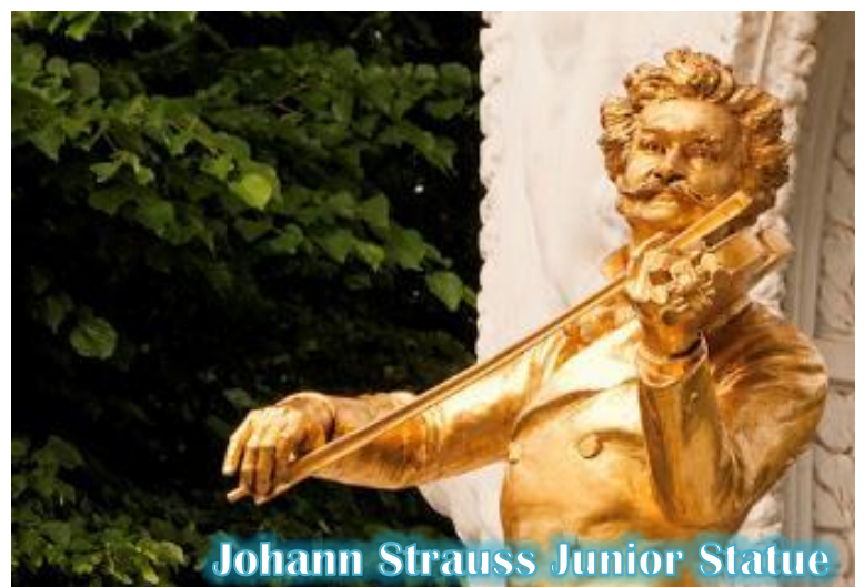
Johann Strauss Junior Statue

เช้า บริการอาหารเช้า ณ ห้องอาหารของโรงแรม นำท่านออกเดินทางเข้าสู่ใจกลาง “กรุง เวียนนา” (Vienna) ผ่าน“ถนนวงแหวน” Ring Strasse ซึ่งเป็นที่ตั้งของ โรง อوبرาการ (โอเปร่าเฮาส์), พระราชวังฮอฟบวร์ก, อาคาร รัฐสภา, ศาลาว่าการ, มหาวิทยาลัยเวียนนา, โบสถ์ประจำเมือง, ศาลสูง ฯลฯ เดินทางสู่ “สวนสาธารณะสตัดปาร์ค” สวนสาธารณะอัน ร่มรื่นใจกลางเมือง ชม “อนุสาวรีย์ โยฮันสเตร ้าส์ จูเนียร์” Johann Strauss ศิลปินที่มี ชื่อเสียงก้องโลก