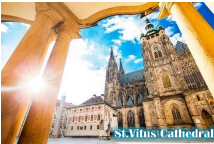
St. Vitus Cathedral