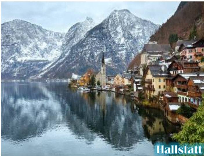
Hallstatt View point

*** บริษัทฯขอสงวนสิทธิ์ในการย้ายโรงแรมที่พักไปยังเมืองเซนต์ว็อล์ฟกัง หรือ เซนต์กิลเกน (ริมทะเลสาบ) แทน ในกรณีโรงแรมในหมู่บ้านฮัลล์สตัดท์เต็ม ***