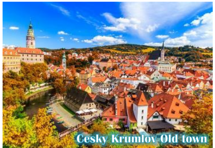
Cesky Krumlov Old town

บ่าย นำท่านเดินทางสู่ “เมืองเชสกี้ ครุมลอฟ (เมืองมรดกโลก)” เป็นเมืองขนาดเล็กในภูมิภาคโบฮีเมียใต้ของ สาธารณรัฐเช็กมีชื่อเสียงจากสถาปัตยกรรม และศิลปะของเขตเมืองเก่าและปราสาทครุ มลอฟ ที่ยังคงมีเสน่ห์เหมือนอยู่ในเทพนิยายมา จนถึงทุกวันนี้ และน่าจะเป็นเมืองที่สวยงามที่สุดใน สาธารณรัฐเช็ก, เชสกี้ ครุมลอฟได้รับการจัด อันดับให้อยู่ในสิบเมืองที่สวยงามที่สุดในโลก เป็น หนึ่งในสถานที่ที่สวยงามที่สุดและไม่ควรพลาด ในการเดินทางไปสาธารณรัฐเช็ก เดินเล่นไปบน ถนนในยุคกลาง ปราสาทสไตล์บาโรกที่ไม่บุบ