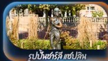
รูปปั้นชาร์ลี แชปลิน

14-22 ต.ค. 69 / 21-29 ต.ค. 69 28 ต.ค. - 05 พ.ย. 69 / 04-12 พ.ย. 69 / 10-18 พ.ย. 69