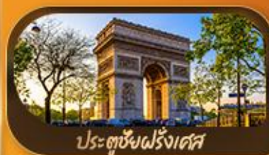
ประตูชัยฝรั่งเศส