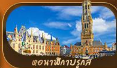
หอนาฬิกาบรูจส์

สัมผัสความสโลว์ไลฟ์ล่องเรือชมหมู่บ้านกังหัน กังหันลมชาเนสส์คินส์ คลองอัมสเตอร์ดัม ตื่นตาตื่นใจกับปราสาททราเวนสติน หอระฆังแห่งเกนต์ ย้อนอดีตโบสถ์อวาร์เลดี หอนาฬิกาบรูจส์ บริสเซลส์ อะโดเมียม รูปปั้นแมนิกันพิส พระราชวังหลวงแห่งบริสเซลส์ เข็มนาฬิกาโลก ประตูชัยฝรั่งเศส หอไอเฟล พิพิธภัณฑ์ลูฟร์ ล่องเรือแม่น้ำแซนสุดโรแมนติก และช้อปปิ้งจุใจที่ห้างชั้นนำ