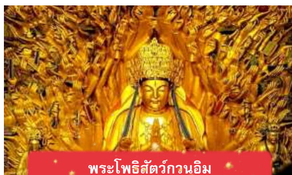
พระโพธิสัตว์กวนอิม

นำท่านเดินทางสู่ มรดกโลกอุทยานผาหินแกะสลักต้าจู๋ ศิลปะหินแกะสลักอันล้ำค่าแห่งเมืองฉงชิ่งมรดกโลกที่องค์การยูเนสโกขึ้นทะเบียนเมื่อปี ค.ศ. 1999 ตั้งอยู่ทางตะวันตกของนครฉงชิ่ง ประเทศจีน ศิลปะหินแกะสลักเหล่านี้สร้างขึ้นตั้งแต่ราชวงศ์ถังจนถึงราชวงศ์ซ่ง มีอายุมากกว่า 1,000 ปีโดดเด่นด้วยงานแกะสลักทางพุทธศาสนาที่งดงามและยังคงสภาพสมบูรณ์ (ใช้เวลาเดินทางประมาณ 1-2 ชั่วโมง)