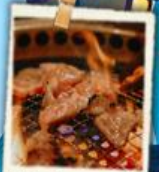
หมูย่างเกาหลี