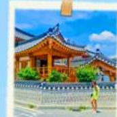
หมู่บ้านอินพยอง