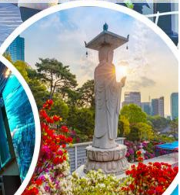
วัดพงจินซา