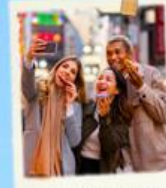
ตลาดชองแด