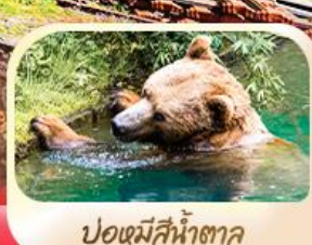
ป้อมีสีน้ำตก