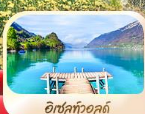
อิชลทอวอลด์