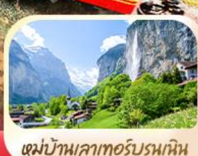
หมู่บ้านเลาทอร์บรุนเนิน