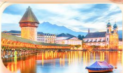
สะพานไมซ์าเปค