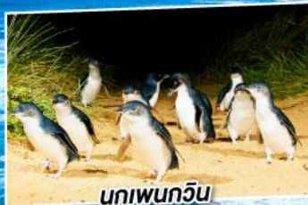
นกเพนกวิน