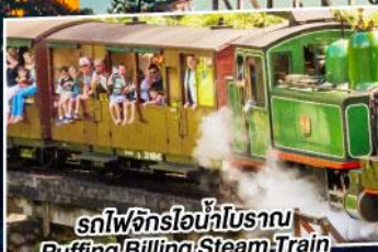
รถไฟจักรไอน้ำโบราณ Puffing/Billing Steam Train